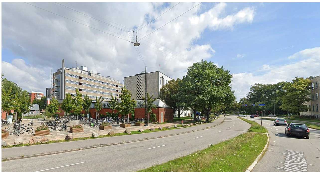
Den lave, røde bygning forrest i Universitetsparken 2, 2100 København (bygning 12.1.166), Auditorium 3, er sted for Svampedagen, lørdag den 22. februar 2025. Der er betalingsparkering i kvarteret omkring, og der er mulighed for at få gratis P-kort til dagen i universitetsområdet syd for vejen Universitetsparken (mellem Nørre Allé og Tagensvej).