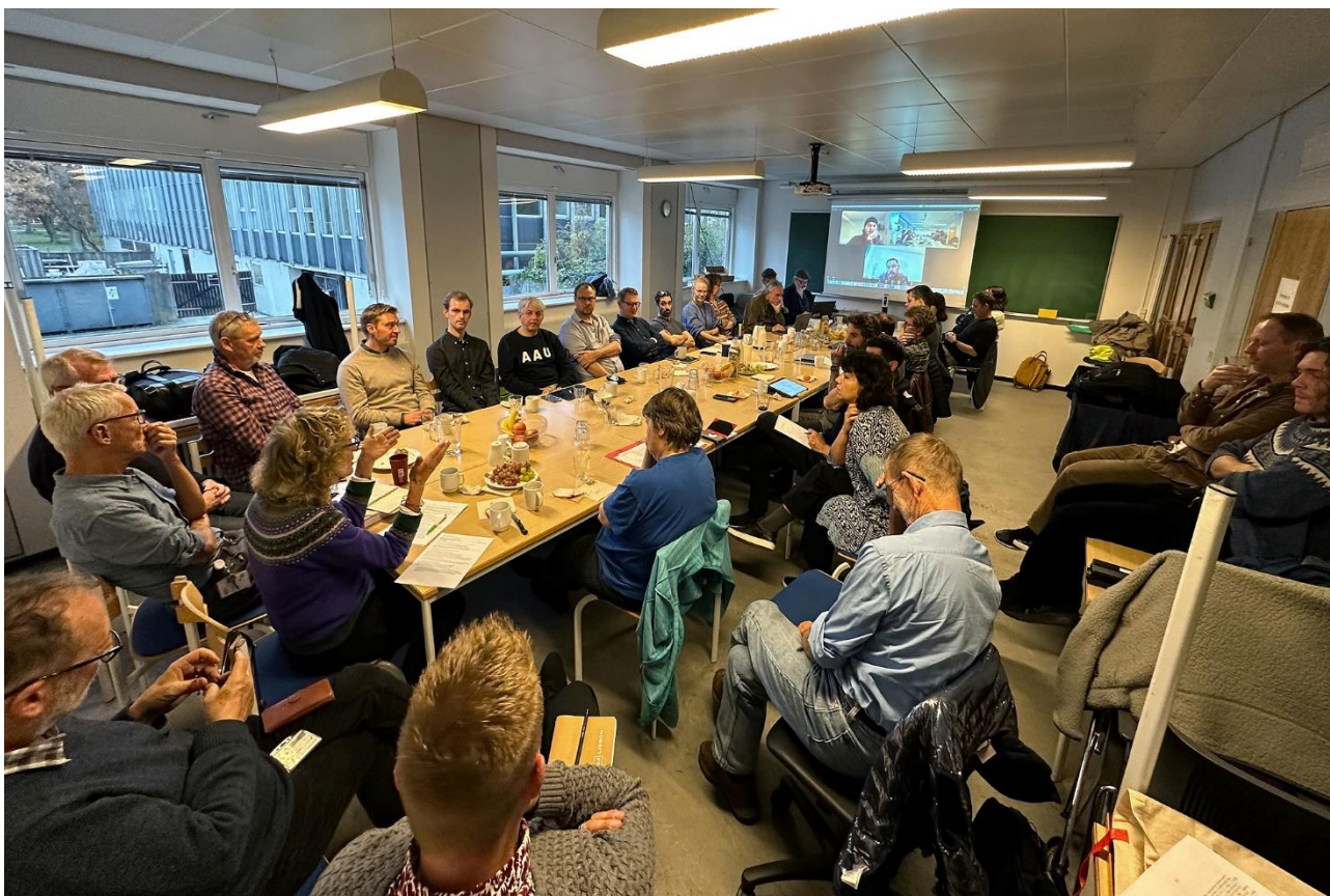
MycologyDK Network-møde på Biologisk Institut, KU, 12. november 2024.