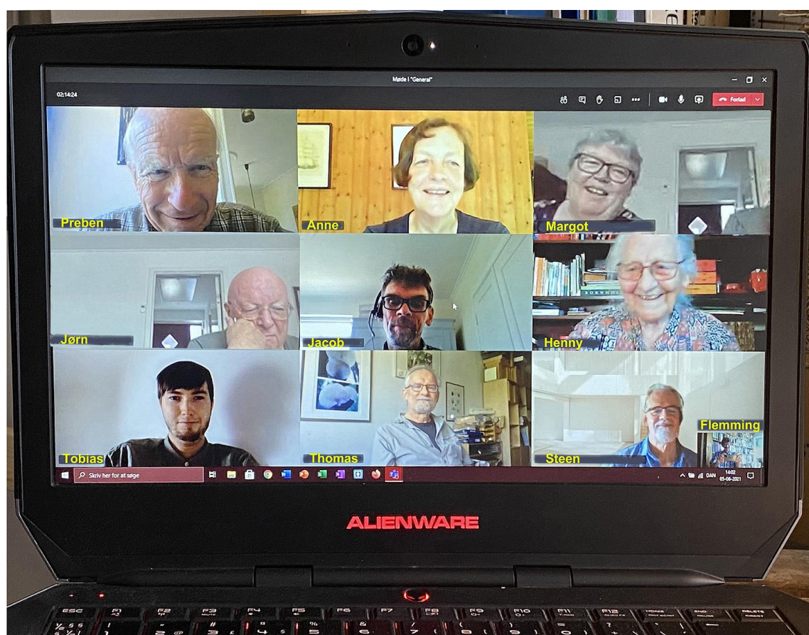
Bestyrelsen set fra formandens pc under online-bestyrelsesmødet den 5. juni 2021.

I lighed med de tre foregående møder blev bestyrelsesmødet lørdag den 5. juni holdt over internettet ved hjælp af 'Microsoft Teams'. Ni deltagere + formanden mødtes virtuelt og arbejdede sig gennem dagsordenens 17 punkter på godt tre timer.