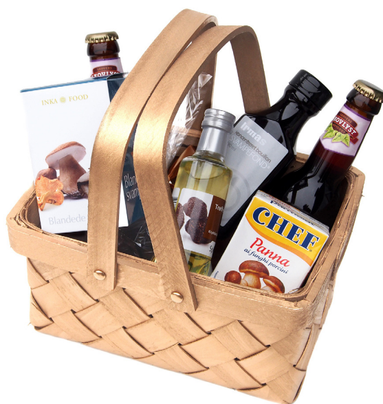
Henny Lohse ved suppegryden på Lokalafdelingen Sjællands årlige tur til Hvidekilde i Gribskov – velfortjent modtager af »Den gyldne svampekurv«, 2015. Foto: F. Rune, 14. september 2003.