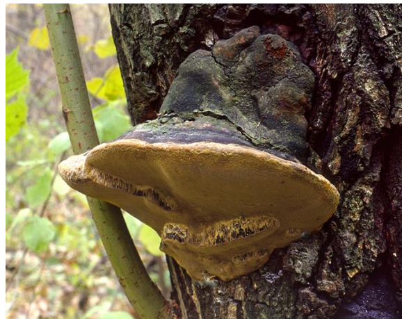
Ege-Ildporesvamp (Fomitiporia robusta) på gamle ege – en af de truede svampearter, vi gerne vil arbejde for at beskytte, uanset vor almennyttigheds-status.

Det er en skam, at de indbetalte gaver til foreningens gavekasse ikke har kunnet hjælpe med til at give os den almennyttigheds-status, som vi selv føler os berettigede til. Vi modtog lidt over 100 pengegaver i 2020 og godt 25 i 2021. Beløbene fra disse står samlet på foreningens gavekonto, og vi håber at kunne øremærke dem til nogle særlige formål, der kommer medlemmerne til gode.