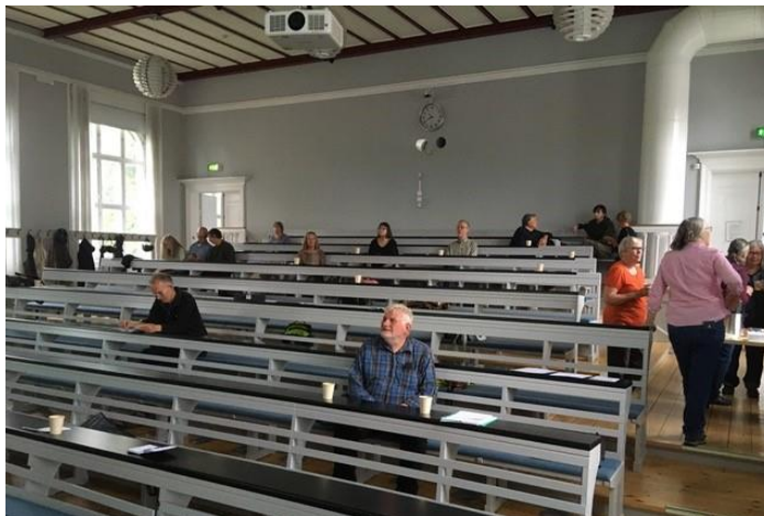
Generalforsamlingen og mini-svampedagen blev for første gang afholdt en sommereftermiddag og tiltrak ca. 35 deltagere.