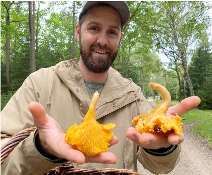
Glade svampesamlere i Tisvilde Hegn med kantareller i det fugtige efterår.