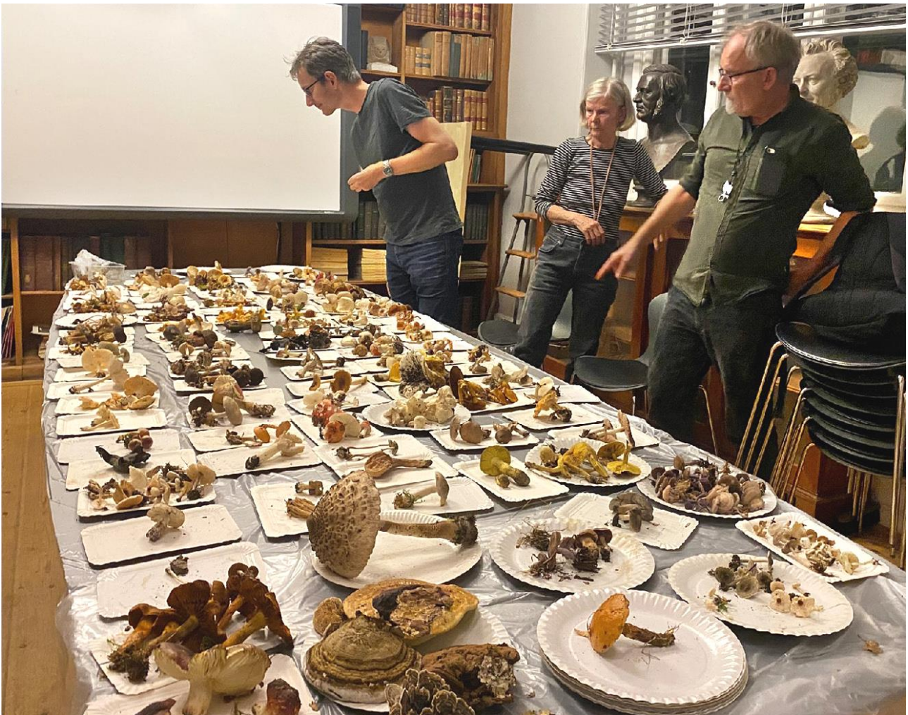
Eksamensbordet var traditionen tro fyldt til diplomprøven, den 4. oktober 2021.

Dér er noget at øve sig på for fremtidige diplomprøve-kandidater. 😊