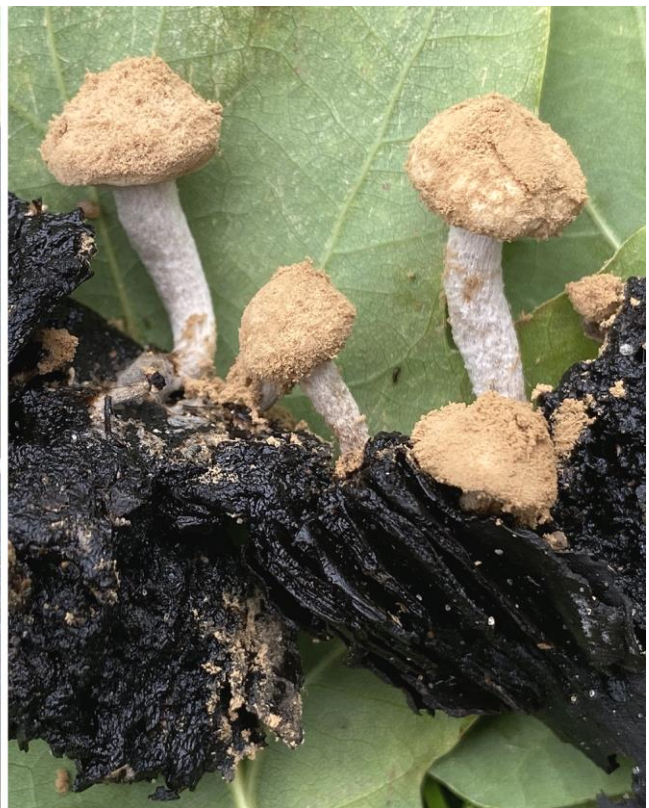
Brunpudret Snyltehat (Asterophora lycoperdoides) snylter på rådne skør- og mælkehatte. Her ses de samme frugtlegemer med 6 dages mellemrum, til højre opløst i ukønnede, brune sporer. Selv om den ikke hører til diplomprøvepensum, er den spændende at kunne fortælle deltagerne om på en svampetur.

Fotos: F. Rune, 18. & 24. september 2021.